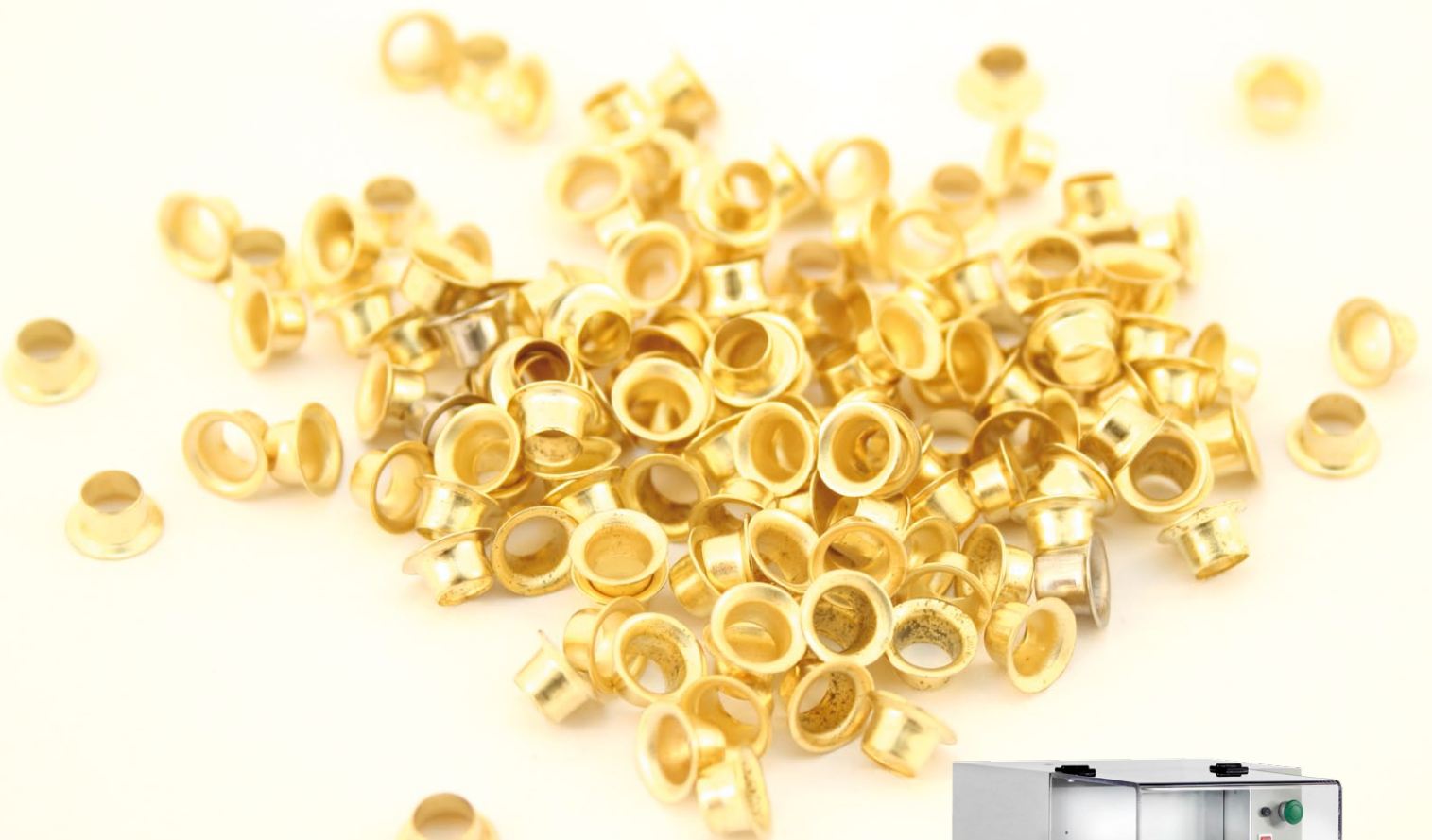
Doppellösmaschine PiccoStar 102-60