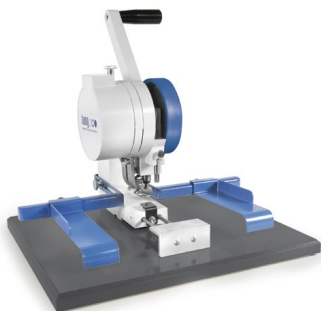
Modell 102-00 / 102-04