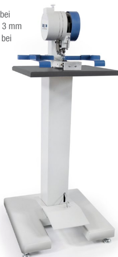
Modell 102-20 / 102-28